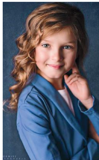
zdj. Mirosława Porwicz Fotografia

Bez internetu nie wyobrażamy już sobie życia. Na każdym etapie i w każdej prawie sytuacji nasze życie istnieje w sieci. Zdjęcia pojawiają się w portalach społecznościowych szybciej, niż my na świecie. Oceny rodzice poznają, nim zdążymy się nimi pochwalić po przyjeździe ze szkoły. Informacje, gdzie przebywamy znajomi widzą poprzez lokalizator w telefonie, a w samochodzie nie ma mapy papierowej tylko nawigacja. Mapę papierową widziałam w swoim życiu tylko raz w samochodzie dziadka, który do tej pory twierdzi, że „internet wyprowadzi nas w pole, a mapa doprowadzi do celu”. [...] bs