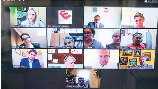
zof. UG Pawłowice

Państwowy Powiatowy Inspektorat Sanitarny w Tychach poinformował Urząd Gminy, że otwarcie placówek dla dzieci i młodzieży uważa w obecnej sytuacji za niewskazane, dlatego zajęcia w szkołach i przedszkolach zostały zawieszane co najmniej do 5 czerwca.