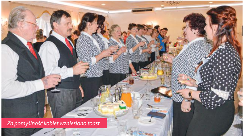
Za pomyślność kobiet wzniesiono toast.