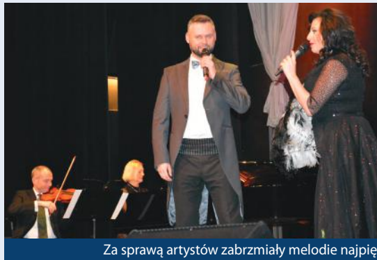
Za sprawą artystów zabrzmiały melodie najpiękniejszych arii operetkowych.