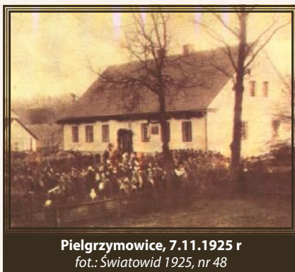
Pielgrzymowice, 7.11.1925 r