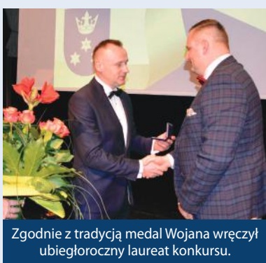
Zgodnie z tradycją medal Wojana wręczył ubiegłoroczny laureat konkursu.