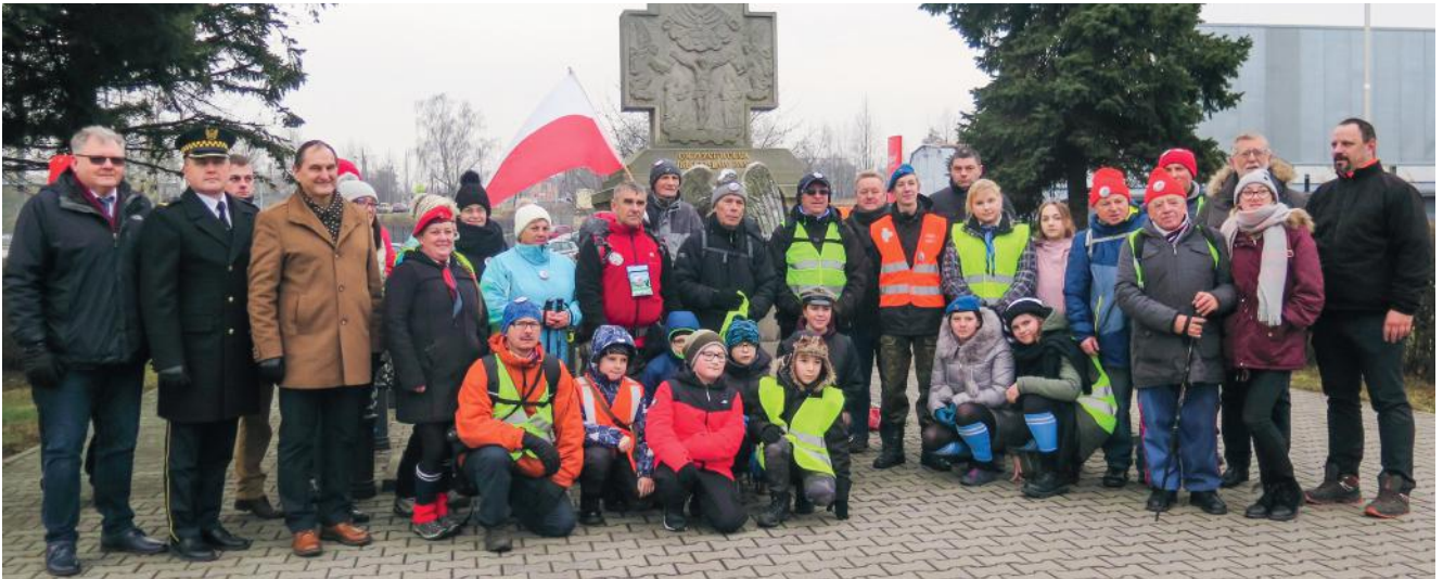
zdj. UG Pawłowice